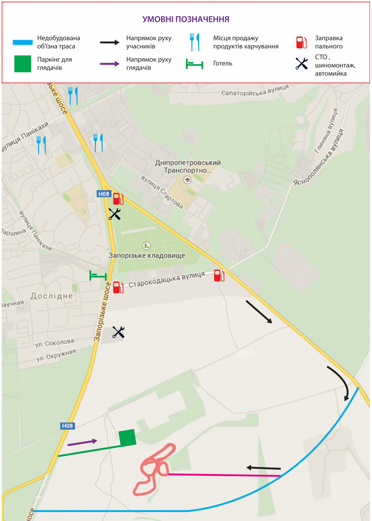
Додаток 2. План місцевості, з вказуванням розміщення траси, інших установ.